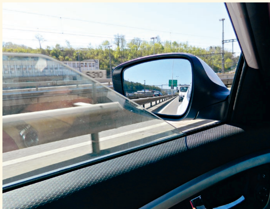
DAS LICHTHUPEN IST NUR ERLAUBT, WENN ES UM DIE SICHERHEIT GEHT.

Auf den Autobahnen geht es immer ruppiger her und zu. Dabei verstossen so einige, die sich im Recht fühlen, ganz klar gegen das Gesetz.