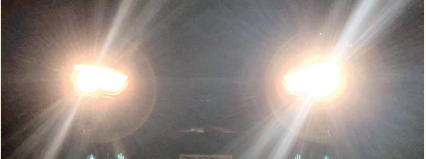
BEKANNTE SITUATION: KAUM AM ÜBERHOLEN, SCHON KLEBT EINER AN DER STOSSTANGE.

SVG. Der Korrekte überholt zuerst gesetzeskonform, der Sonntagsfahrer wechselt ohne zu blinken, was bereits eine strafbare Handlung ist (Anzeigen Richtungswechsel), ebenfalls und verkürzt dem Überholenden auf diese Weise den Mindestabstand. Wird dieser nicht eingehalten, kommt es vom korrekt Fahren zur Widerhandlung gegen das SVG. Ebenso macht sich der auf-fahrende Tempobolzer strafbar, indem er eine grobe Verkehrsregelverletzung begeht, was wiederum zu einer Anzeige und dem sofortigen Führerausweiszug führt. Auch die Frustration des Korrekten zieht eine verkehrsrechtliche Ahndung nach sich. Tritt er in die Eisen, um wieder einen genügenden Abstand zum Tempobolzer zu erzwingen, kann dieses Verhalten bei einer Anzeige allenfalls als Nötigung ausgelegt werden.